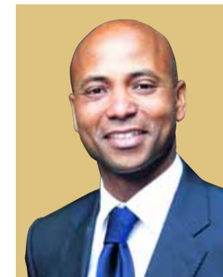
Humberto Tan: verandering.

Woody Allen maakte met Blue Jasmine weer eens een echt donker drama. Jasmine, een fenomenale rol van Cate Blanchett, krijgt een zenuwinzinking. Door de economische crisis en het overspel van haar ex-man (Alec Baldwin) wordt zij gedwongen zichzelf opnieuw uit te vinden. Jasmine is verwend en opportunistisch en velt een hard oordeel over anderen. Antidepressiva en haar drankzucht blijken een venijnige cocktail. Blanchett is griezelig geloofwaardig. Laat die Oscar maar komen.