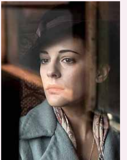
Vanwege de oorlog vlucht Eve (Phoebe Fox) naar een afgelegen landhuis, maar daar blijkt het niet bepaald veiliger.

'THE WOMAN IN BLACK: ANGEL OF DEATH' ★★★★★